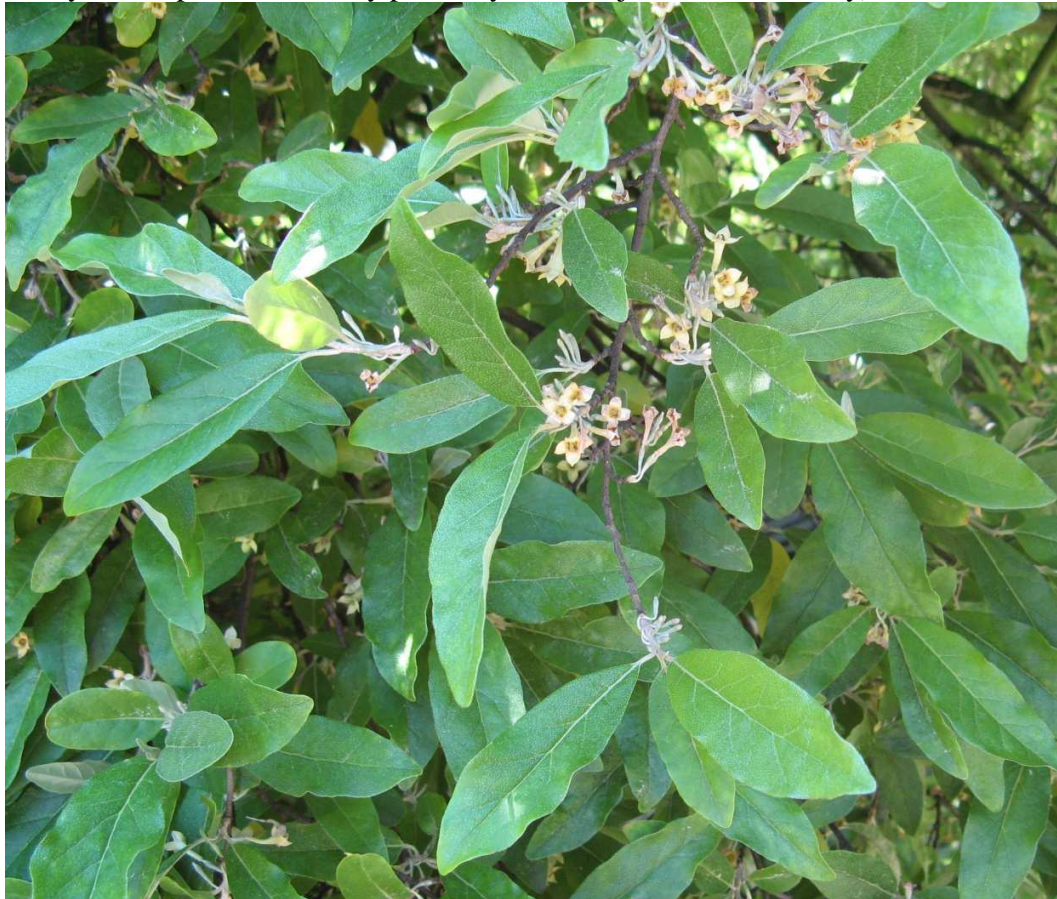
Listy – střídavé

Květy – oboupohlavné, někdy přítomny i samčí (jednodomé rostliny), 4četné